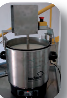
Pasteurisateur type bain-marie 20 litres