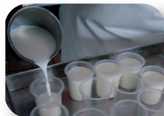
Mise en pots manuelle