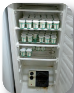
Congélateur recyclé en étuve à yaourts grâce à l'installation d'un convecteur électrique couplé à un thermostat