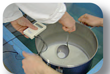
Refroidissement du lait pasteurisé dans un bain d'eau froide

Remarque : La pasteurisation est considérée comme un point critique : la température et le temps de pasteurisation doivent donc être systématiquement enregistrés (dans le cahier de fromagerie par exemple)