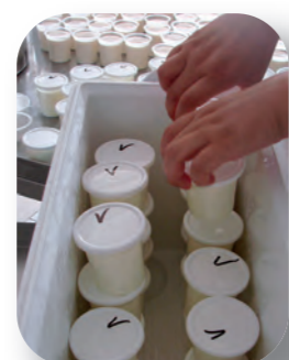
Étuvage en glacière

Bien utilisée, elle permet de conserver suffisamment de chaleur pour permettre à la fermentation de se dérouler correctement et obtenir ainsi le niveau d'acidité escompté.