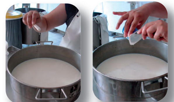
Ensemencement à partir d'un yaourt du commerce