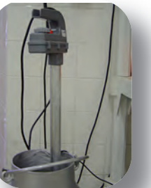
Pasteurisation du lait au moyen d'un thermoplongeur