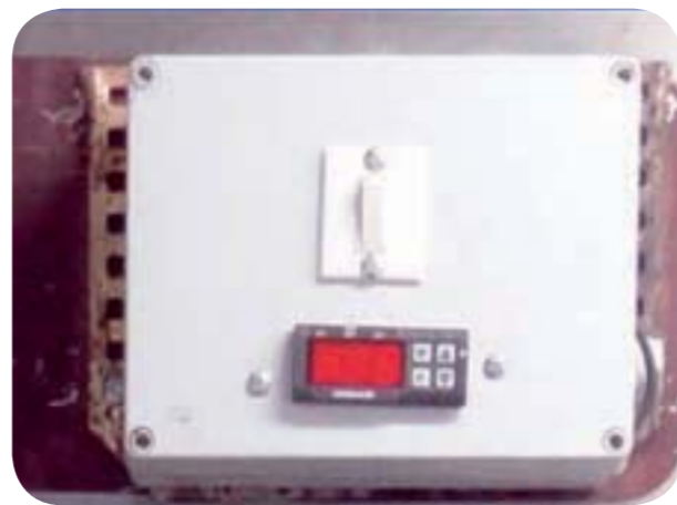
Figure 6 : Thermostat électronique avec affichage digital

grammes tels que des durées d'étuvage, ou un préchauffage de l'étuve à une heure donnée.