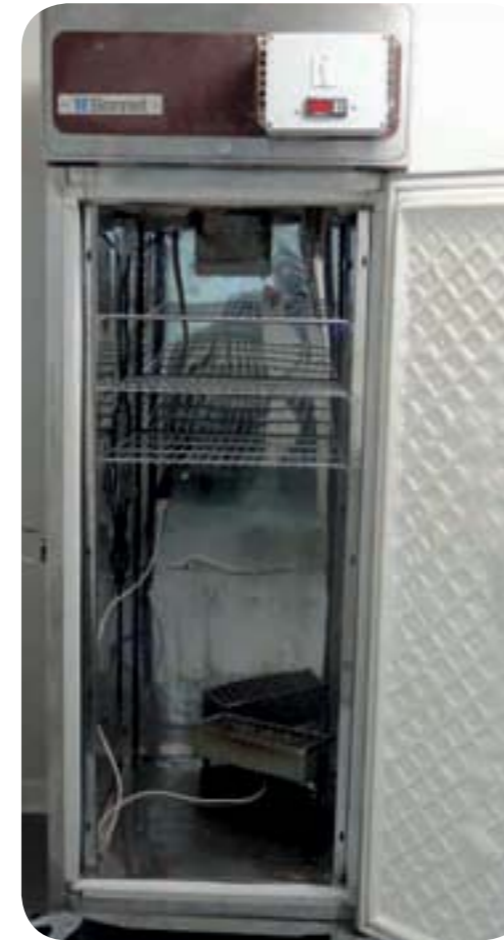
Figure 7 : vue d'ensemble d'une installation

http://www.castorama.fr/store/Chauffage-dappoint-Sunball-prod7220009.html?navCount=0