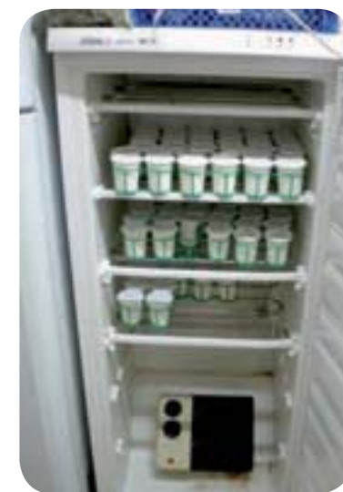
Figure 2 : Installation munie d'un chauffage électrique d'appoint

Plusieurs systèmes peuvent être utilisés. Les chauffages d'appoint électriques sont sans doute les plus simples à installer : ils possèdent déjà tous les branchements nécessaires, comportent le plus souvent un ventilateur ainsi qu'un thermostat (voir paragraphe suivant). De plus, ils sont très puissants, et permettent un bon maintien en température. Seuls défauts : ils sont gourmands en énergie, et ne sont pas conçus pour travailler dans des ambiances closes, leur indice de protection (IP) étant faible. (Prix neuf : 50 € environ).