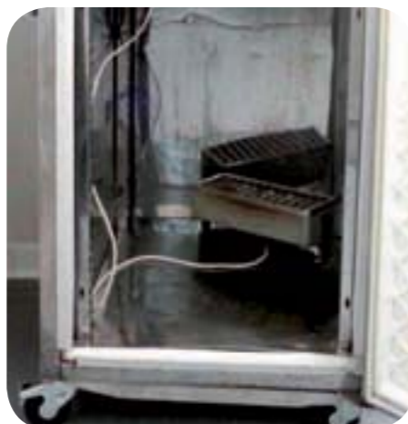
Figure 4 : système de chauffage par résistance

Par contre, la résistance est ici posée à même le fond de l'étuve. Cette position n'est pas des plus judicieuses, (risque de court circuit si de l'eau ou du lait est renversé).