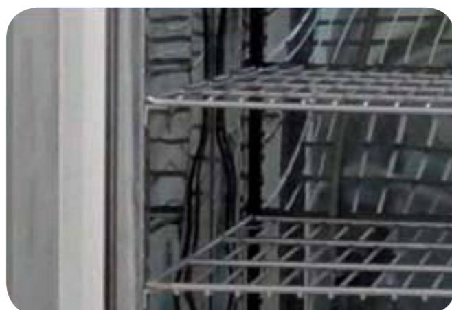
Figure 5 : Système de glissière sur cornières égales