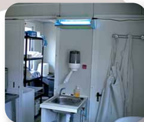
Salle de fabrication