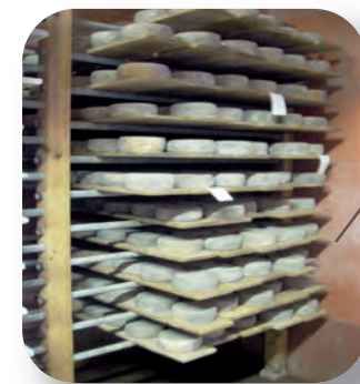
Exemple d'un système d'étagères fixes avec affinage sur planches en bois mobiles

✓ Le conseil du technicien : il est préférable de choisir un système avec planches en bois mobiles car il a l'avantage de faciliter le nettoyage des planches, le retournement et le frottage des fromages lors de soins à apporter en affinage. Mais aussi d'avoir des planches d'affinage de divers formats.