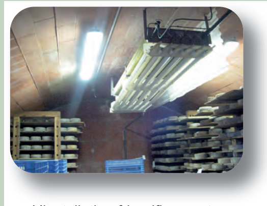
Cave d'affinage avec une installation frigorifique à évaporateur statique

Le paramètre essentiel d'une installation frigorifique à détente indirecte est son delta T. Cet indicateur correspond à la différence entre la température d'évaporation du fluide frigorifique (HFC) dans l'évaporateur et la température de la pièce. Cet écart ne peut être inférieur à 4.5-5°C. Le delta T recommandé doit être inférieur ou égal à 5°C. Plus le delta T est élevé, plus l'installation assèche. Pour l'affinage des fromages à pâte pressée à croûte grise, il est recommandé de choisir, une installation frigorifique dite à évaporateur statique. En effet celui-ci permet de garantir plus facilement une hygrométrie supérieure à 95% et ne produit pas de ventilation de l'air dans la pièce. Les inconvénients de l'utilisation d'un évaporateur statique, sont son encombrement et son coût plus élevé qu'une installation frigorifique à évaporateur dynamique.