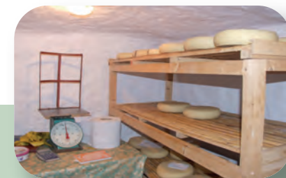
Exemple de réhabilitation d'une cave naturelle :

Le mur de la cave est recouvert de plaques de brique creuse