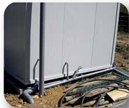
Raccordement des siphons de sol de la fromagerie modulaire au système de traitement des eaux usées, ici une fosse septique + épandage souterrain

Il est également possible d'acheter un module neuf, livré sur site de pose, sans équipement intérieur construit sur la base du plan type ci-dessus, comprenant seulement la structure du module c'est-à-dire les fenêtres, les portes, les panneaux sandwich extérieurs et les cloisons intérieures pour un prix compris entre 4000 et 8000 € HT.