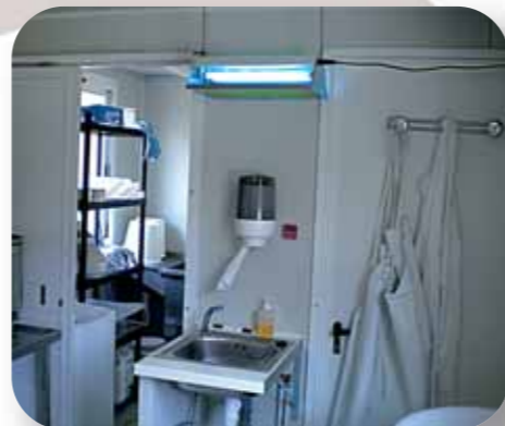
Salle de fabrication