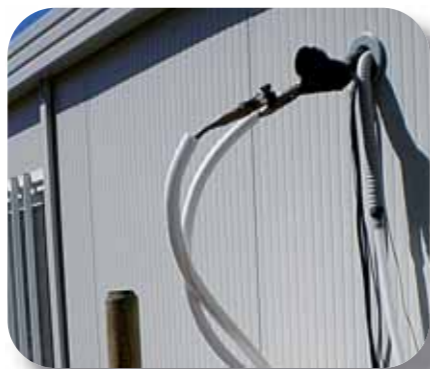
Raccordement au réseau électrique de la fromagerie modulaire