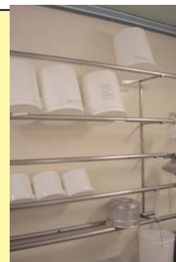
Barres d'égouttage pour les seaux