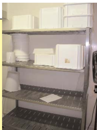
Etagère trop haute