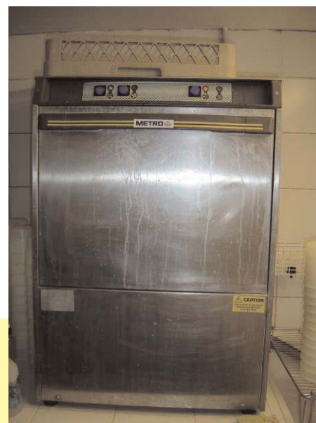
Lave-vaisselle de restauration