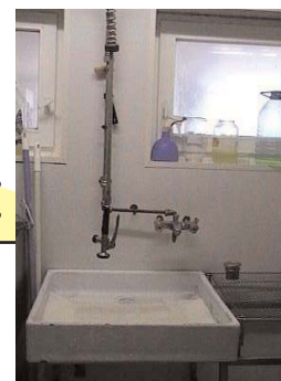
Système de douche avec bac de douche