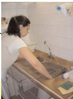
Un bac trop petit