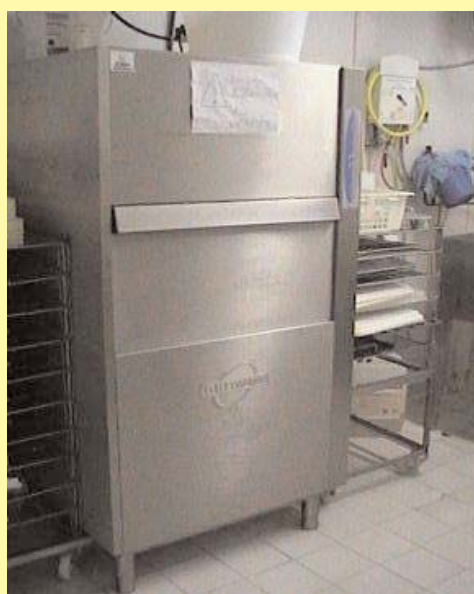
Lave-vaisselle professionnel acheté neuf