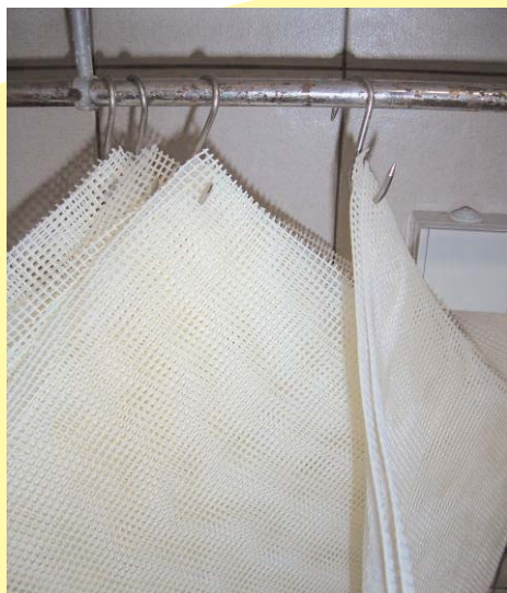
Des crochets pour faire sécher les stores