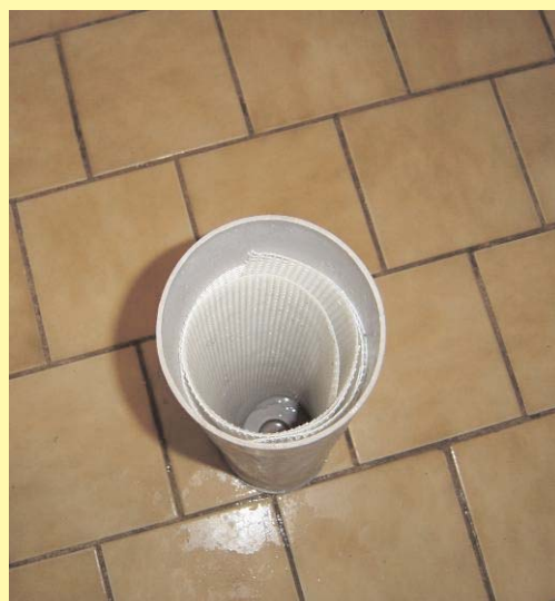
Un tuyau PVC pour faire tremper les stores avec un encombrement réduit