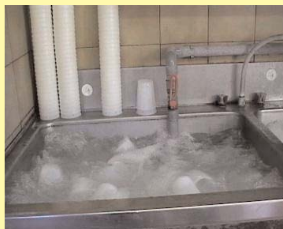
Système de bac à agitation pour nettoyer les moules

Concernant le choix d'un équipement automatisé, un guide non exhaustif (n'aborde pas les tunnels de lavage), présentant quelques machines, leurs caractéristiques techniques, prix et références, est disponible sur demande auprès du Centre fromager de Carmejane