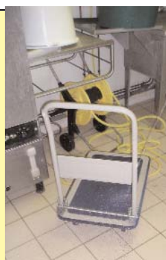
Chariot à roulettes